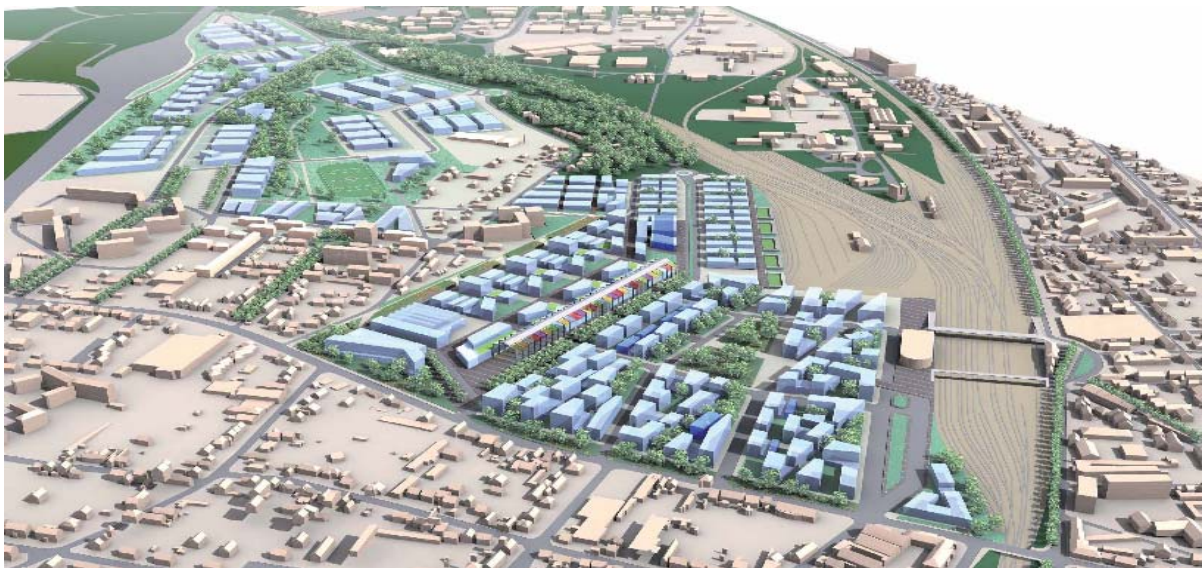
Quartier Mantes-Université. Aménageur : EPAMSA. Architecte-Urbaniste : Bruno Fortier

Plus précisément, cette implication a permis l'émergence d'une nouvelle notoriété, d'une nouvelle image qui a créé les conditions d'une réponse aux attentes sociales et d'un retour de l'investissement privé. Le projet Mantes Université en est une des illustrations : ce sont 1 200 logements nouveaux, des programmes de bureaux, un pôle de commerce à l'échelle des 100 000 habitants de l'agglomération et un pôle universitaire scientifique qui se développent au pied de la gare de Mantes la Jolie.