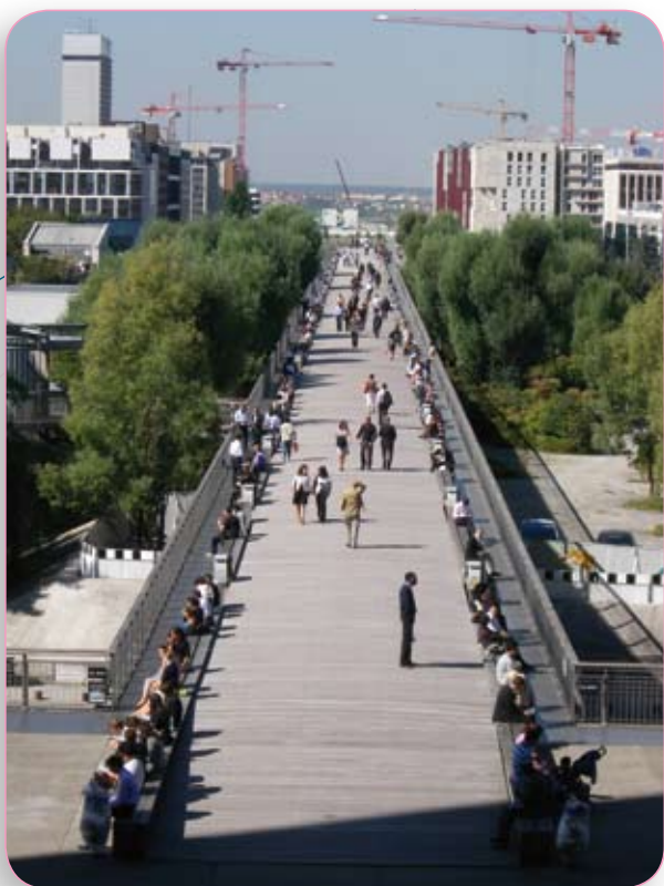
La Défense, vue vers l'Ouest : un monde piétonnier

La Défense, vue vers l'Est : des espaces considérables à portée de RER/métram/tram restent disponibles à la construction de tours de bureaux, et de logements