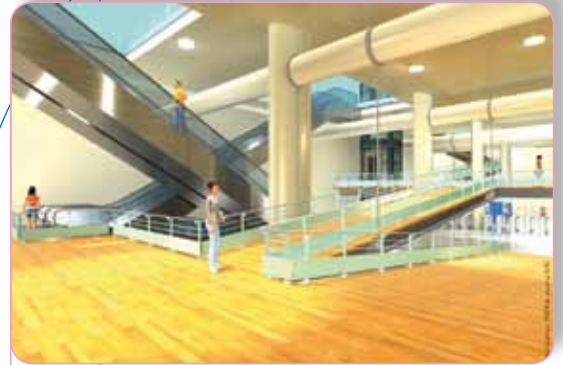
Palier intermédiaire de la salle d'échange

Cette gare profonde s'avère coûteuse (300 millions d'euros) et compliquée à réaliser dans un secteur très contraint ; se pose la question de son financement. En dehors des maîtres d'ouvrage du projet, les financeurs de cette gare complémentaire doivent pouvoir compter sur les partenaires économiques présents dans le secteur, qui bénéficieront immédiatement de la desserte créée et qui auront dès lors la possibilité de marquer concrètement leur intérêt pour cette station.