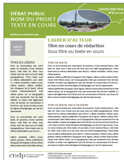
Exemple de première page d'un cahier d'acteur

Le choix d'éditer ou non un point de vue sous la forme d'un cahier d'acteur relève d'une décision de la CPDP. Outre leur publication sur le site du débat, leur mise en page répond à une charte graphique prédéfinie prise en charge, avec leur impression, sur le budget du débat public.