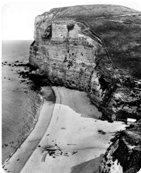
Avant la construction du port pétrolier

Les explosions et les travaux avec l'extraction de 11 millions de tonnes de craie détruisent à tout jamais un espace naturel magnifique (sans compter la disparition d'un site préhistorique).